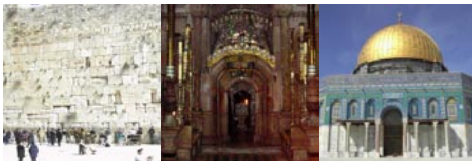
Judarnas klagomur, de kristnas Gravkyrka och muslimernas klippskulptur.

Jag har blivit betydligt mer ödmjuk i mitt förhållande till konflikten under min resa. Jag besökte bland annat den judiska kibbutzen Harduf. Den har antroposofi som grund, en åskådning som jag förknippar med fredligt sinnelag. Det är också så de ser sig själva, men här ser man vad