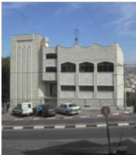
Scouternas hus i Shfar-am.

De hoppas också i framtiden att fler flickor deltar, båda bröderna är väldigt västerländska när det gäller flickor och kvinnors rätt till frihet.