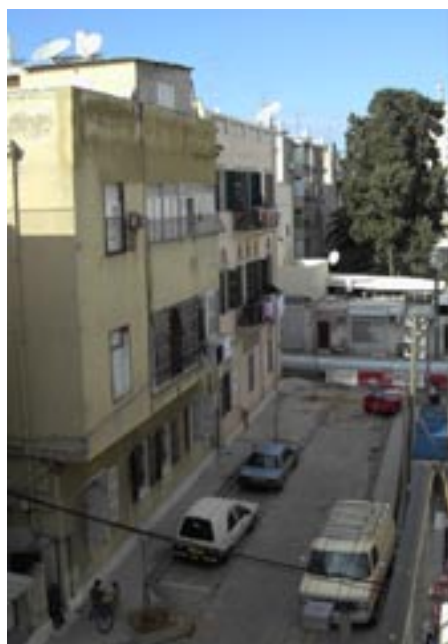
Gatan Le Martin i Jaffa, där jag bodde hos några judiska och arabiska vänner.

Det var lite märkligt att i ett land som i sin grundlag beskriver sig som judisk, bli väckt av en muslimsk böneutropare. Jag har bokstavligen landat mitt i konflikten. Husen i Jaffa där jag bor hos några judiska och arabiska vänner är lite slitna, men det är ett mysigt område - en av endast fem städer där judar och araberna lever blandat, i ett land där en femtedel av befolkningen är arabisk.