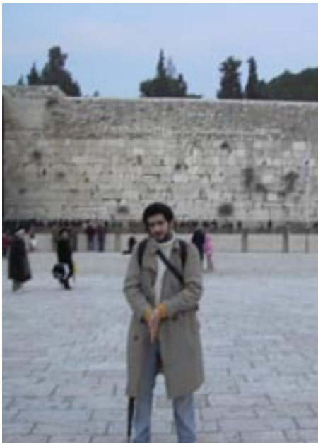
Tzion vid muren där hans folk sökt sig till i två tusen år.

Gamla stan i Jerusalem är dels vad man förväntat sig från TV, dels väldigt annorlunda. Gatorna med kommersen var inte så förvånande, men däremot hur lite man faktiskt vet om Jerusalems byggnader. Jag är ändå uppväxt i ett kristet land, och gick i söndagsskolan som liten. Så träder man in i en kyrka, som faktiskt