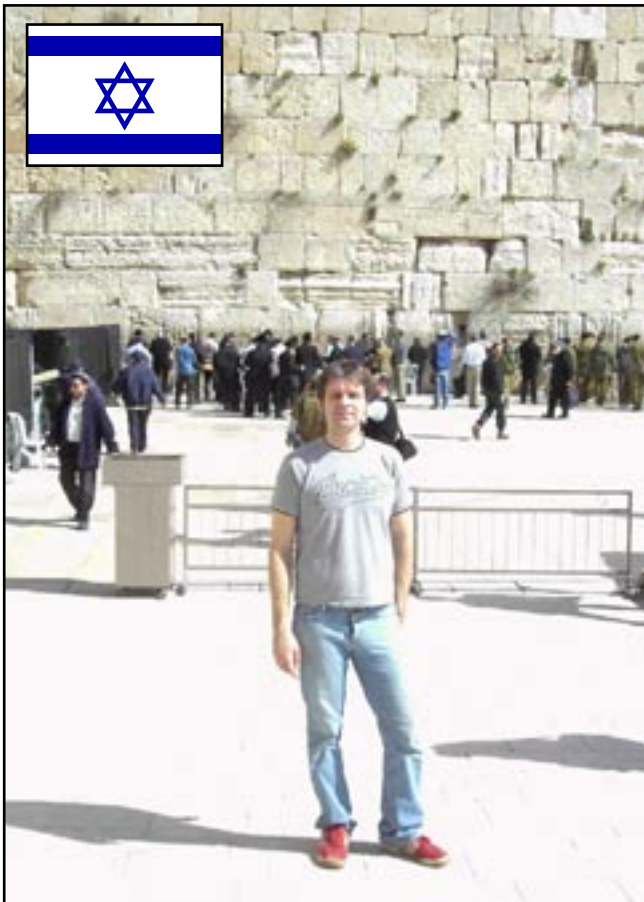
Muren i Jerusalem

Israel och Palestina 11-27 februari 2005