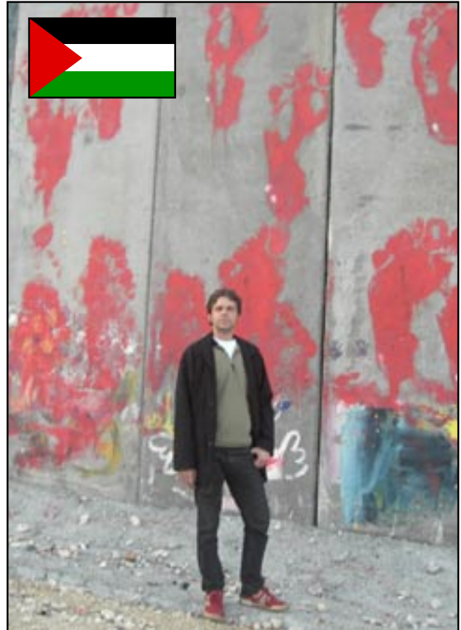
Muren i Betlehem