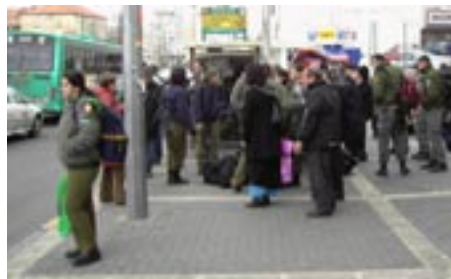
Soldater utanför centrala busstationen i Jerusalem.

Det är en många skillnader mellan Tel Aviv och Jerusalem, en av de mest kännbara är den stora mängd soldater som finns överallt i Jerusalem. Det började redan i Tel Aviv, då även soldater färdas med de vanliga bussarna. Bara under en dag i Jerusalem har jag sett fler beväpnade människor än totalt i hela mitt liv.